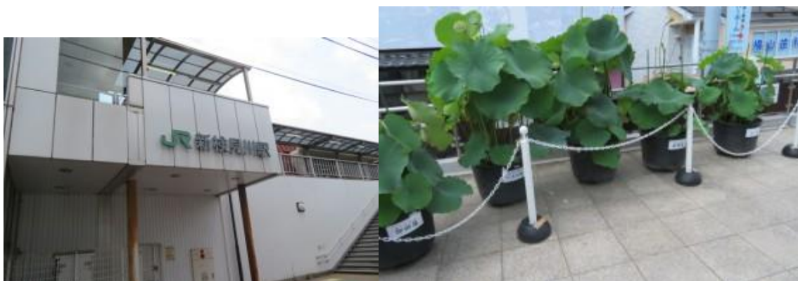
※新検見川駅、5つの蓮