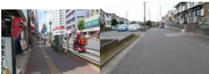
※新検見川駅への路

③12時40分、新検見川駅に向けてスタート。ランチビールで足取りが多少重たかったが、日影の道筋が多かったので、助かった。ただし、今年一番の水分補給が必要となった。12時57分、創価学会前（平和交通）バス停を通過。13時8分、えごだ西公園前を通過。新検見川駅には13時31分到着。駅前には5つの蓮があった。すなわち、即緋蓮、一天四海、春不老、剣舞蓮、天昇。駅舎の通路を歩いて南口に出る。