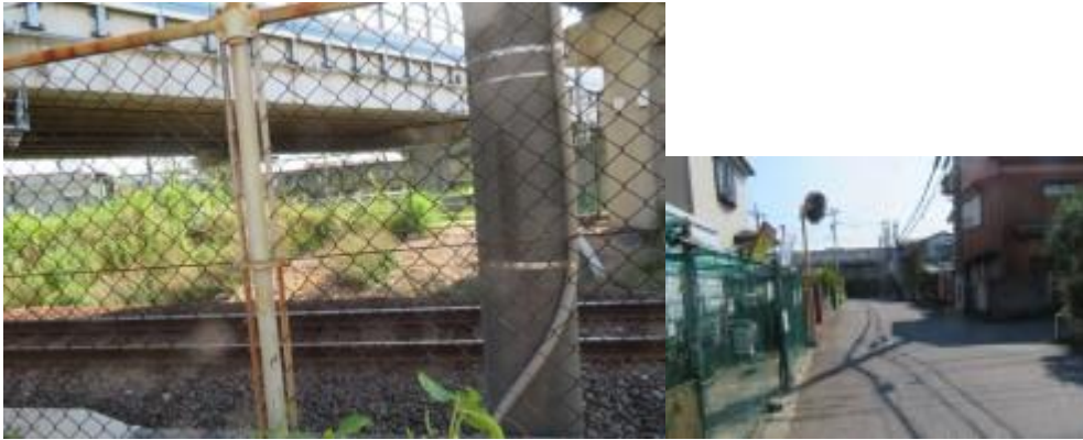
※向こうに見える陸橋が幕張本郷駅への路（？）、津田沼駅への路