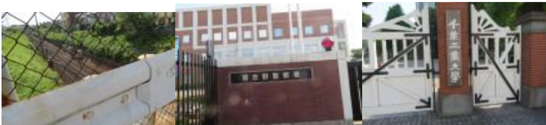
※京成本線を横切る、習志野警察署、千葉工業大学