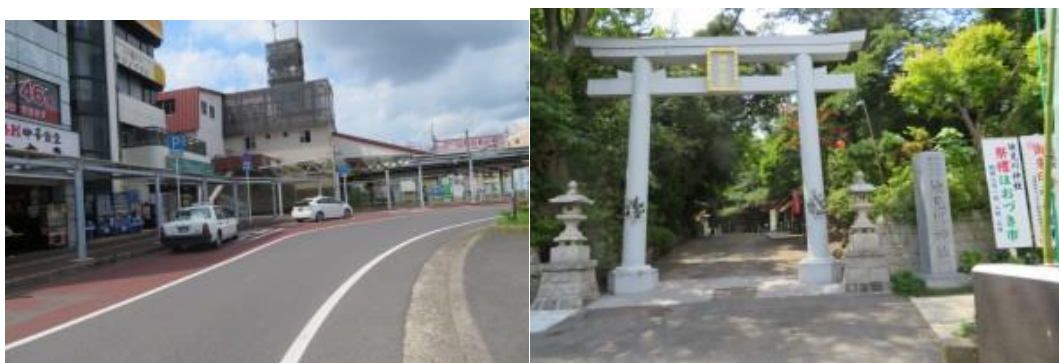
※新検見川駅、検見川神社